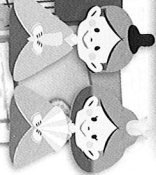
皆さんで甘酒を 頂きました。