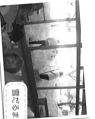
雪だるまを作りました(^_^)v