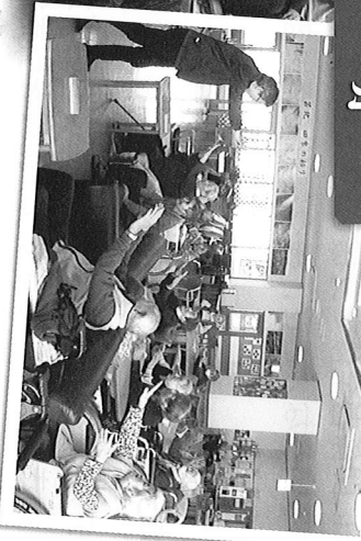
刈屋形神楽団様によります 神武を観覧しました。熱気が 伝わってきました。