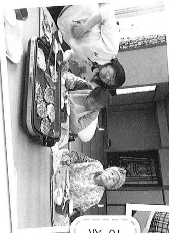
お昼ご飯を職員と一緒に 楽しく食べました。